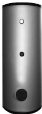
UB 300 SC+/DC+