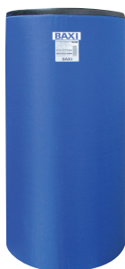
UB 200 SC/DC