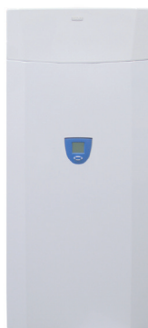
UB 200 SOLAR