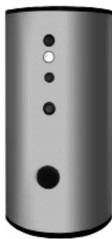
UB 400 SC+/DC+