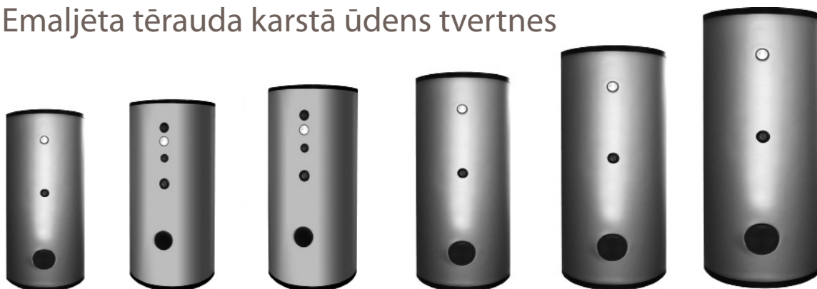
UB 500 DC