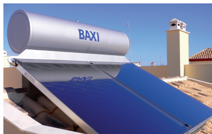
Modeļi 10, 15 l